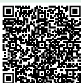
Scan de QR-code en bekijk alle been- en voetbescherming

Naast veiligheidsschoenen kunt u ook bij ons terecht voor klompen, laarzen, kniebescherming en accessoires.