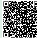
Scan de QR-code en bekijk alle been- en hoofdbescherming