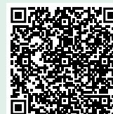
Scan de QR-code en bekijk alle been- en adembescherming